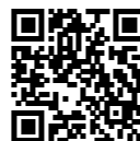
autorka teksta: Jasna Žugić

Njene priče možete da nađete na Fejsbuku, a Staša trenutno radi na novom materijalu za koji kaže da će biti potpuno drugačiji od ovog iz knjige "Ja sam Staša".